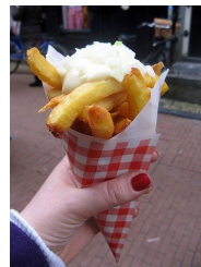
Citeren als: Pinkster, F. M., & Boterman, W. R. (2017). When the spell is broken: Gentrification, urban tourism and privileged discontent in the Amsterdam canal district. Cultural Geographies , 24(3), 457-472.