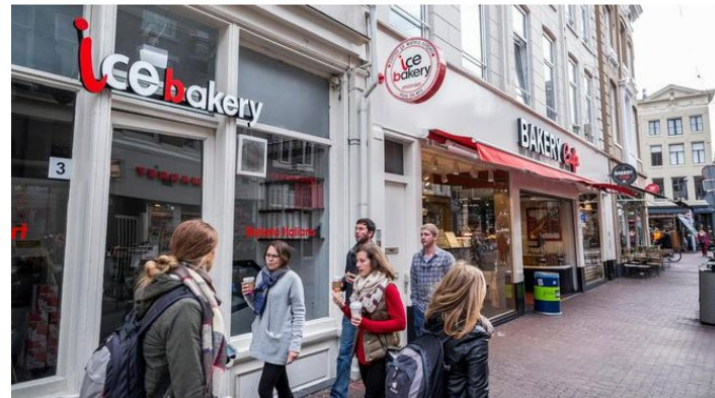
Moorman, M. (1 maart 2017), 'Stop de uitverkoop van Amsterdam'. Het Parool. Online: https://www.parool.nl/columns-opinie/stop-de-uitverkoop-van-amsterdam--ba205a34/