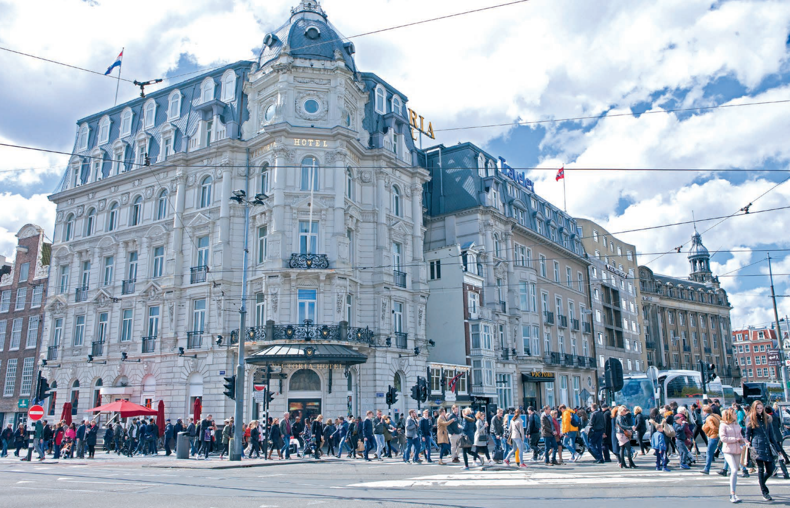
Voetgangersstromen bij het Victoria Hotel tegenover het Centraal Station. De drukte in de binnenstad zorgt voor veel klachten bij bewoners over de leefbaarheid van hun stad.