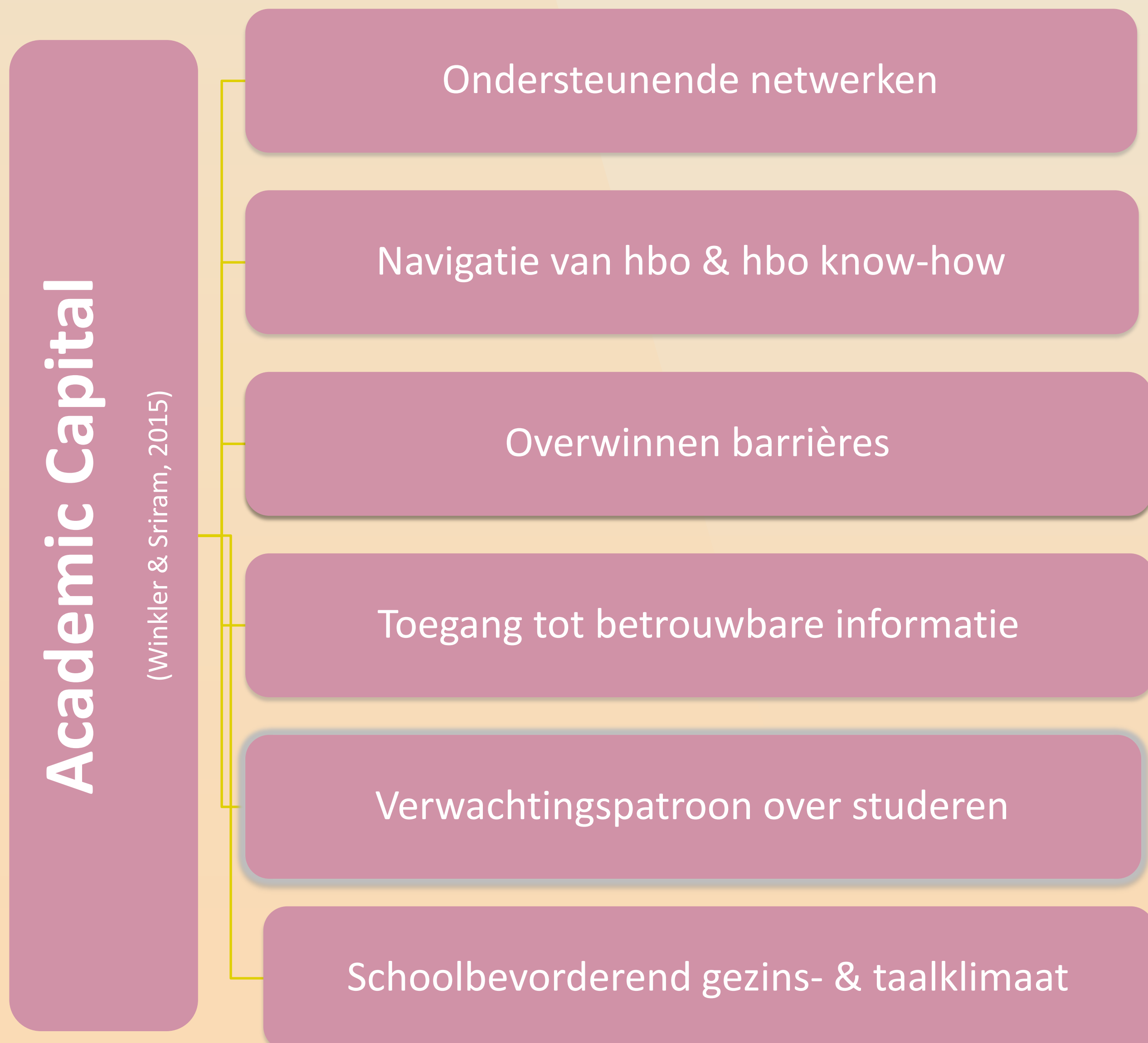
Figuur 1. Aangepast model van Academic Capital Formation naar Winkler & Sriram (2015)