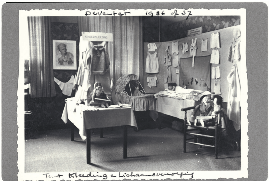
Tentoonstellingszaal Kleding en Lichaamsverzorging, Deventer, 1936 of 1937

burgers, om de betrokkenheid te verhogen. Op dit punt kan er wat van het verleden geleerd worden. De Huizen voor Ouders stonden open voor raad en ideeën van bezoekers: uitwisseling zou het contact en de samenwerking tussen de Huizen en de bezoekers alleen maar ten goede komen. Bij de ingang lag dan ook altijd een boek waarin bezoekers op- en aanmerkingen konden schrijven. Hoewel een klein idee, creëerde het een 'wij-gevoel', dat bij de CJG's nog niet te vinden is. Wellicht kan uitgaan van de ouders en een moderne vorm van een notitieboekje de drempel bij ouders, jeugdigen en kinderen wegnemen.