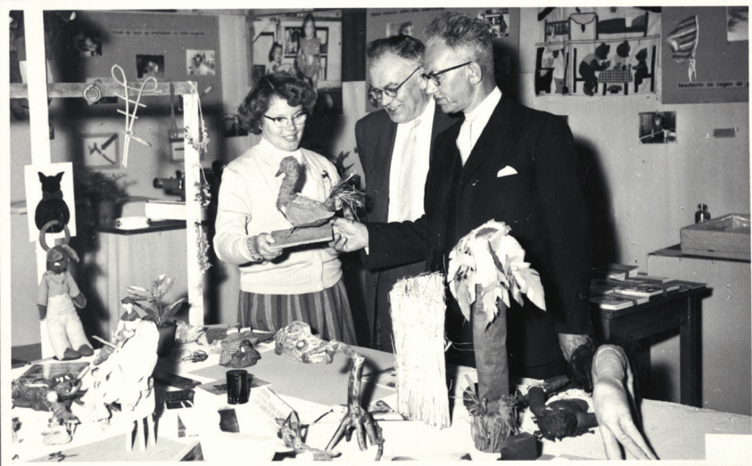
3 personen bij voorlichtingsmateriaal

De sociale netwerken van nu op internet zijn succesvoller. Op oudersonline.nl vinden dagelijks duizenden ouders elkaar. Andere sites zoals jמודers.nl en opvoedmix.nl halen cijfers waar menig Huis voor Ouders toen en CJG's nu alleen maar van kon dromen. Het internet brengt ouders van nu bij elkaar op allerlei sites. Op deze sites geven en krijgen ouders informatie en advies en emotionele steun. Soms helpen ouders elkaar verder door te wijzen op andere bronnen voor sociale steun. Ondersteuning kan zo thuis worden geboden, veilig – en dat is relatief nieuw – anoniem in de wijde wereld van het web.