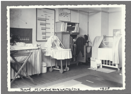
Tentoonstellingszaal Kinderverzorging, 1938

In deze brochure stellen we de lezer graag voor aan het rijke verleden van de K en O-vereniging. We doen dat door het verleden van de roemruchte vereniging telkens te verbinden met het (ook rijke) heden. We doen dit aan de hand van zeven thema's.