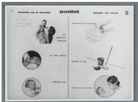
'Gezondheid', onderdeel van de Platenatlas, 1938.

Empirisch gebleken effectiviteit en de classificatie daarvan speelde honderd jaar geleden, bij K en O, nog geen rol. De aangeboden ondersteuning werd als effectief beschouwd wanneer er vanuit de praktijk goede reacties kwamen. K en O steunde bovendien op de kennis van deskundigen uit diverse disciplines en beroepssectoren. Deze deskundigen stonden aan het hoofd van de 20 afdelingen van het Reizend Museum. Tot de grootste en meest praktische afdelingen behoorden de afdeling 'Lichamelijke ontwikkeling en verzorging van het kind', 'Voeding', 'Kleding', 'Kinderstudie & Kinderontwikkeling' en de afdeling Fröbelmethode & Handenarbeid. Het Museum probeerde alle facetten van de opvoeding te behandelen en een zo breed mogelijk kader aan te bieden. Daarom ook vernieuwden de afdelingen regelmatig de inhoud en voorlichting om aan de vragen en behoeften van ouders te voldoen en daarbij ook nieuwe bezoekers aan te trekken.