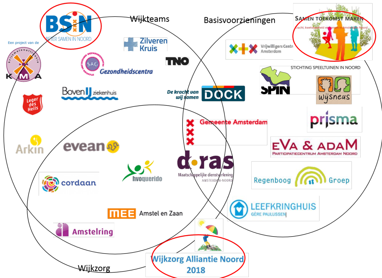
Figuur 1: Samenwerkingsverbanden formele organisaties in Noord

De samenwerking tussen formele partijen in Beter samen in Noord, De Wijkzorg Alliantie Noord en Samen Noord is weergegeven in Figuur 1.