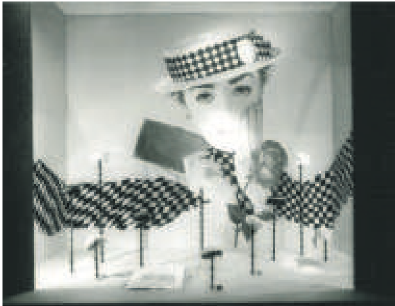
Sjeng Scheijen AMSTERDAM

'Nederland toonaangevend in etalagekunst,' schreef het Algemeen Dagblad in november 1959, zonder ironie. De krant had het over de etalages van de Bijenkorf, die sinds 1956 werden ingericht door de jonge binnenhuisarchitect en ontwerper Benno Premsele.