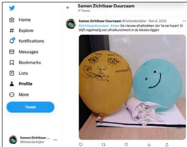
Figuur 2: Quotes en beelden zijn getweet in het kanaal 'De Verderkijker' https://twitter.com/DeVerderkijker

Van de meest aansprekende WOW en OWW situaties zijn foto's gemaakt. De quotes en beelden zijn gedeeld via tweets, als online variant van de fysieke muur. Zie figuur 2 en 'De Verderkijker' op Twitter: https://twitter.com/DeVerderkijker .