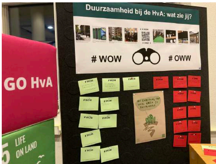
Figuur 1: De #WOW & #OWW muur met uitspraken van voorbijgangers op kaartjes

Bezoekers van het Kohnstammhuis worden gevraagd twee kaartjes in te vullen: een groene voor iets wat WOW is op het gebied van duurzaamheid, en een rode voor iets wat (nog) OWW is. Mensen blijken graag bereid te zijn om hier even over na te denken. Na het invullen volgt een kort gesprekje, waarin de interviewer een idee krijgt van de kennis van duurzaamheid en duurzaamheidsmaatregelen onder studenten en medewerkers.