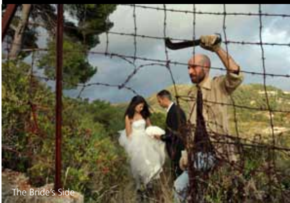
The Bride's Side

Students that Matter Filmfestival bij FLOOR dinsdag 13 oktober, Kohnstammhuis