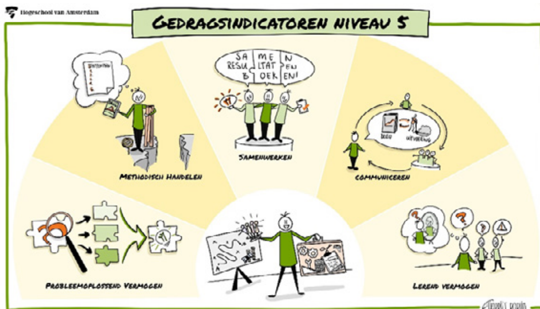
Figuur 1: Gedragsindicatoren niveau 5

Associate degree opleidingen zijn in het European Quality Framework (EQF) en het Nederlands Kwalificatieraamwerk (NLQF) gepositioneerd en uitgewerkt op niveau 5. Ter vergelijking: een mbo-4 opleiding is niveau 4, een bachelor-opleiding niveau 6. Voor het Associate degree-niveau (niveau 5) hebben wij ons gebaseerd op de beschrijving van niveau 5 van het EQF, het daarvan afgeleide NLQF en de landelijke beschrijving van niveau 5. Een beschrijving van het Associate degree niveau is vastgesteld door het Overlegplatform Associate degree van de Vereniging Hogescholen (separate bijlage 9). Hierin is niveau 5 uitgewerkt aan de hand van vijf gedragsindicatoren, probleemoplossend vermogen, methodisch handelen, samenwerken, communiceren en lerend vermogen, die het niveau duiden waarop de beroepstaken moeten worden uitgevoerd.