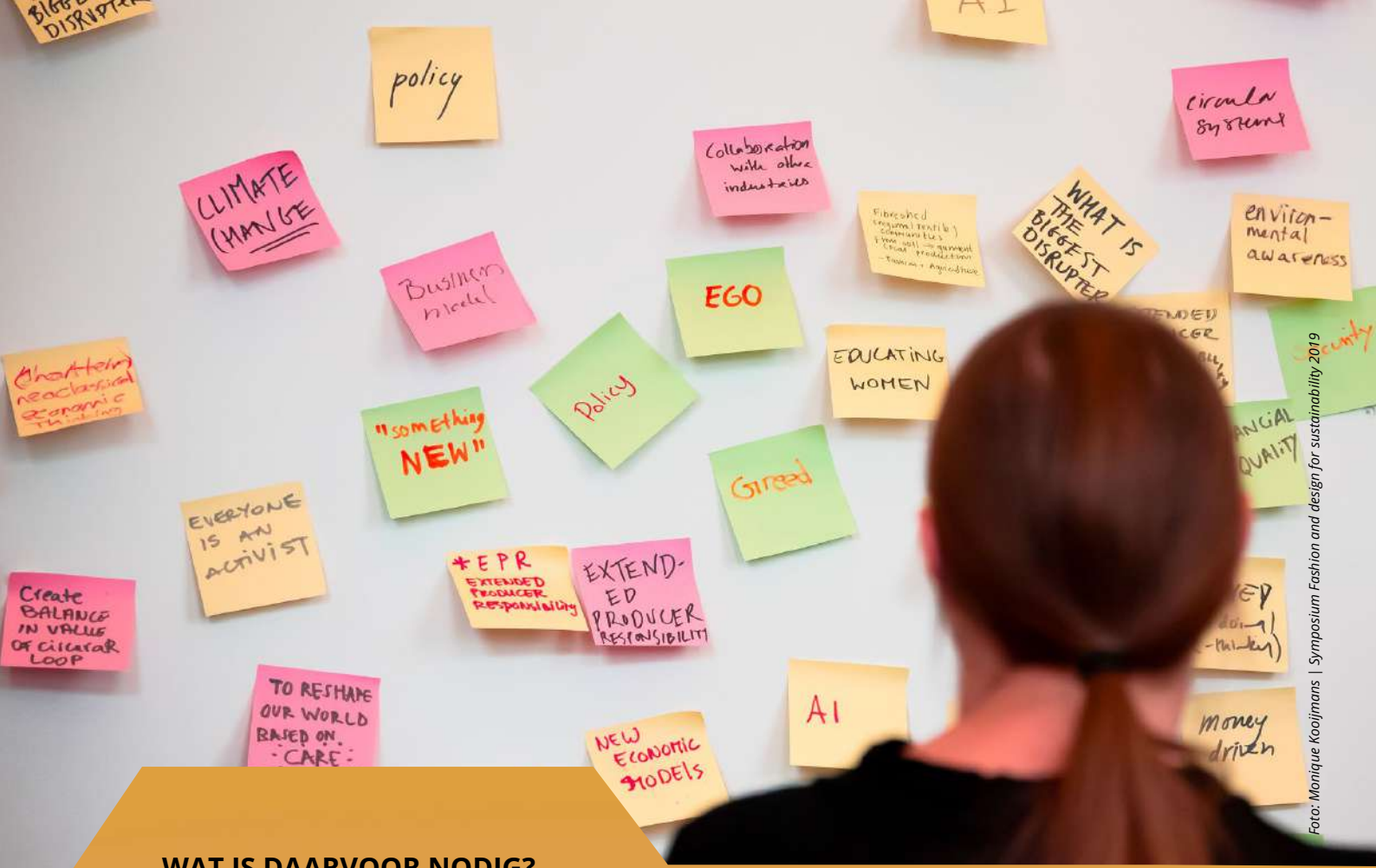
Symposium Fashion and design for sustainability 2019