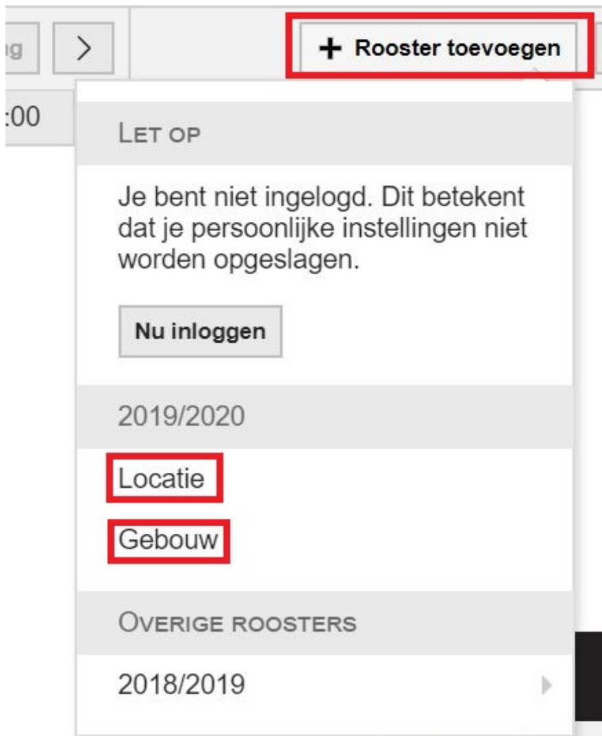
Fig 2. Keuze afzonderlijke ruimtes of heel gebouw