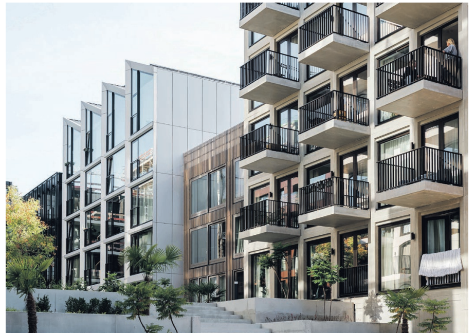
Stadswerf Oostenburg Groot-schalige ontwikkeling van een voormalige stadswerf (VOC) met 450 woningen (koop, sociaal, midden en vrije sector). Gemeenschappelijke binnentuin, afwisseling in hoogte. Stedenbouw in hoge dichtheid, dat de Van Gendthallen overschaduwde. Architecten: Ronald Janssen, Bastiaan Jongerius en Paul de Ruiter.