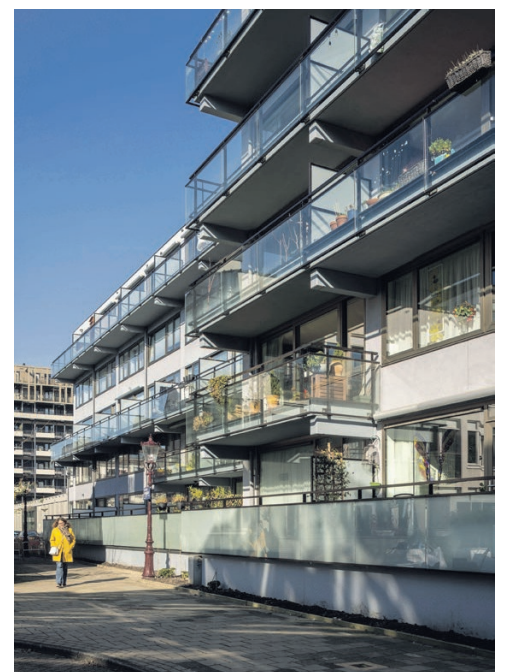
De Burman De vve heeft de oude appartementen in de Burmandwarsstraat (bij de Weesperzijde) uit de jaren tachtig gerenoveerd en geïsoleerd, en er bovendien een nieuwe etage op geplaatst met vijftien appartementen. Er zijn ook trappenhuisen en een lift toegevoegd. Architect: Xoomlab, Harvey Otten & Joost Vorstenbosch.