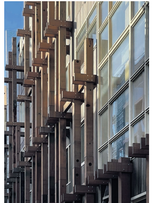
De Warren Wooncoöperatie ontwikkelde een complex dat gericht is op verbinding en ontmoeting. Delen is het devies: de gemeenschappelijke ruimtes, de binnentuin, de woongroepen – er zijn er vijf – die ook nog profiteren van de inbreng door klein en groot gedeerte. Houtbouw. Architect: Natruffed.