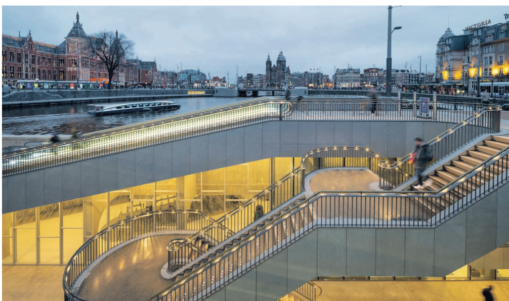
Fietsenstalling Open Havenfront De garage onder het IJ was nog niet klaar, maar deze wel, in de eerste week van januari. Plaats voor 7000 fietsen tussen paddestoelvormige kolommen, met kunstwerken op de muur – beelden van de Amsterdamse geschiedenis. Rolpaden en -trappen verbinden de Prins Hendrikkade ondergronds met de verdelhal van metro en trein. Architect: Wurck.