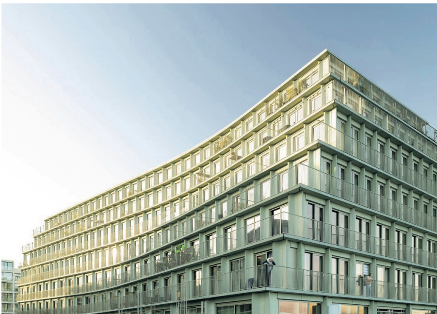
De Jakoba Dit project, met 135 studioappartementen die bedoeld zijn voor starters, is het enige in Noord dat is genomineerd. Compact wonen dus, met commerciële voorzieningen in de plint en een gemeenschappelijke binnentuin. Delen is ook hier het sleutelwoord. Architect: Studionedots, Buro Sant & Co.