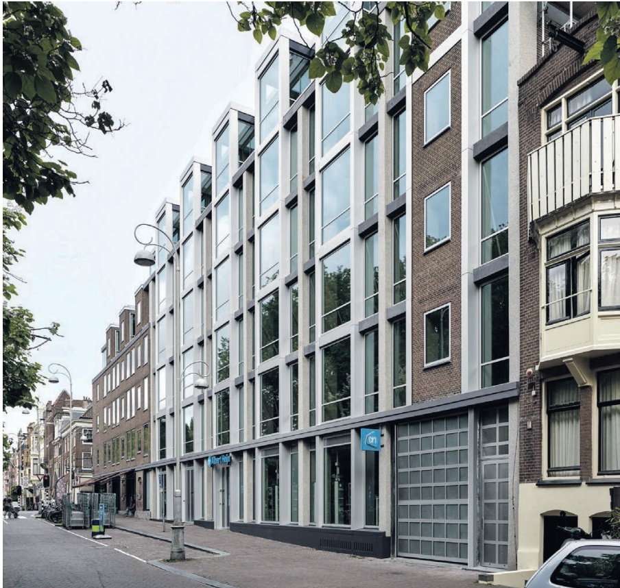
Frederiksplein 1 Kantoorgebouw van Arthur Staal uit 1967, omgevormd tot een modern centrum met werkplekken. Met de historische gebouwen ernaast is een relatie gelegd in het ontwerp. Was ook al genomineerd voor de Zuiderkerkprijs. Architecten: Office Winhov.