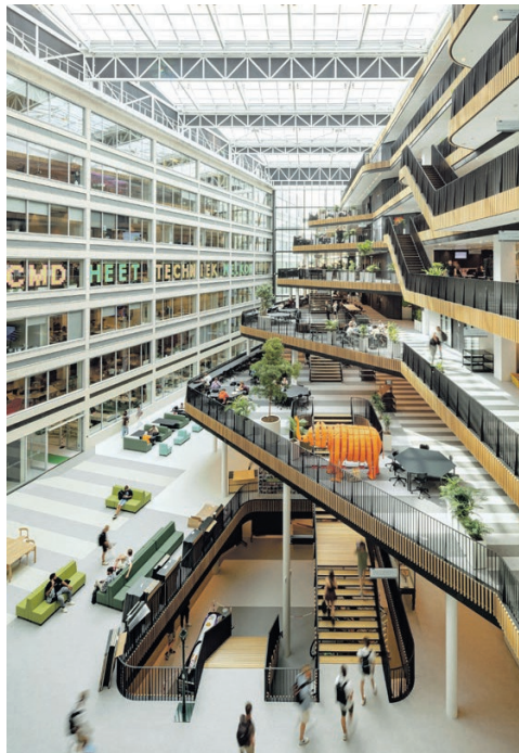
Jakoba Mulderhuis Sluitstuk van de kennismijl van de Hogeschool van Amsterdam op een stukje grond aan de Wibautstraat, waar ooit een transformatorhuis stond. De ontmoeting in het atrium met zijn brede trappen en terrassen is de kern van het ontwerp. Want colleges volgen kun je ook via je laptop. Alle onderdelen kunnen worden gedemonteerd en hergebruikt. Architecten: Powerhouse Company, Architecten Cie en Marc Koehler.