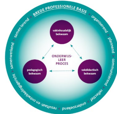
Herijkte bekwaamheidseisen (onderwijscoöperatie, 2014)

In de bekwaamheidseisen is een algemene definitie van bekwaamheid opgenomen alsmede een uitwerking van het vereiste kwalificatieniveau. Daarmee wordt het kader voor de toetsing in de bekwaamheidseisen gegeven. Voor de uitwerking van het kwalificatieniveau binnen de bekwaamheidseisen zijn de referentiekaders van de Dublin-descriptoren en het Europees Kwalificatiekader (EKK) bewerkt.