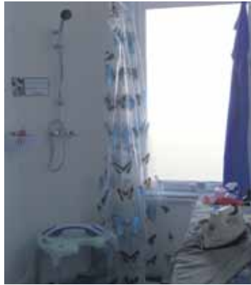
De doucheruimte met douchetips

Bezoekersinformatie Bewoners(groepen) kunnen zich aanmelden via oost@villabewust.nl voor een workshop, informatiebijeenkomst of interactieve rondleiding.