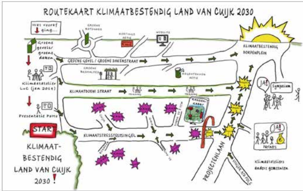
◀ Routekaart van het Impactproject Land van Cuijk.

van Cuijk, vijf lokale klimaatkanskaarten, een regionale intentieverklaring en een lespakket voor scholen. Daarnaast wordt 'klimaat' als specifiek aandachtspunt zoveel mogelijk ingeplugd in reguliere projecten.