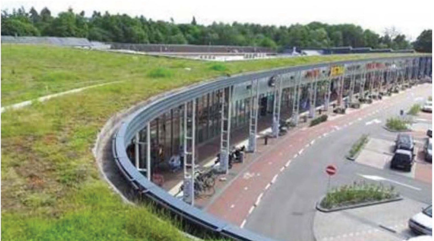
Grasmat tegen de hitte, op een winkelcentrum in Enschede PROVINCIE OVERIJSEL

De provincie Overijssel heeft al wat maatregelen genomen. Zo is er in Enschede een grasmat aangelegd op het dak van een winkelcentrum.