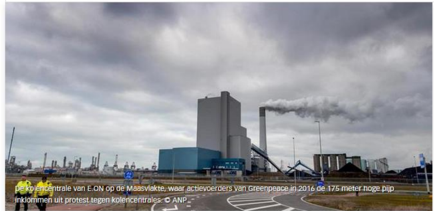
De kolencentrale van E.ON op de Maasvlakte, waar actievoerders van Greenpeace in 2016 de 175 meter hoge pijp inklimmen uit protest tegen kolencentrales.