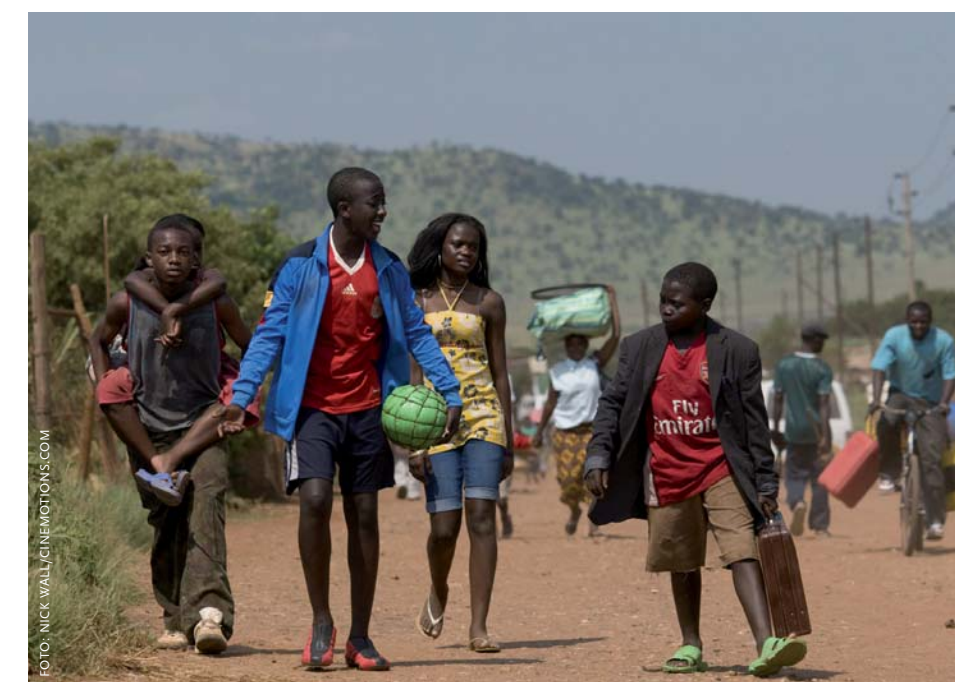
Africa United volgt vijf kinderen op hun reis van Rwanda naar Zuid-Afrika.

Tegelijkertijd onderzocht het Erasmus Centre for Strategic Philanthropy (Erasmus Universiteit Rotterdam) in hoeverre de films van invloed zijn op aspecten van sociaal gedrag van leerlingen.