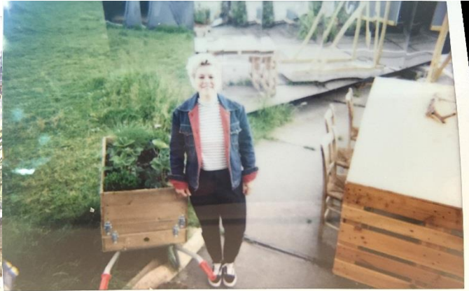
Right Ticket for the Right price