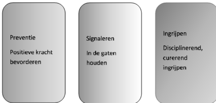
Figuur 1 Interventies

Om te spreken in termen van het medisch, zorg- en veiligheidsdenken, waarin gedacht wordt in drie uiteenlopende en olopende interventies, kennen we: de preventie, het signaleren en het ingrijpen. Het sociaal-cultureel werk is vooral gelokaliseerd in het domein van de preventie. Sociaal-culturele professionals werken met en voor de gehele breedte van de samenleving: voor kwetsbare én voor niet-kwetsbare groepen.