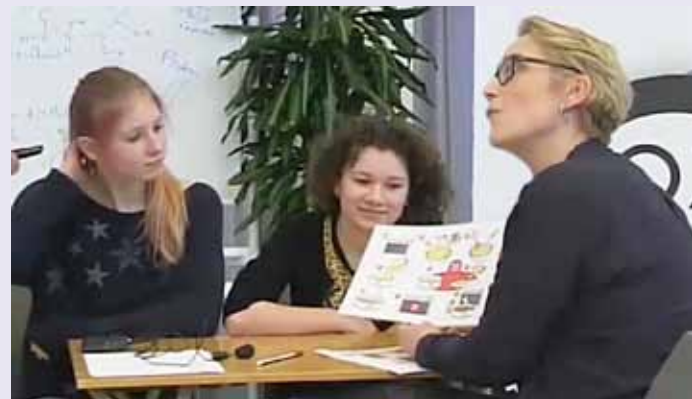
Video still talkshow OnderzoeksTV – uitzending februari 2015

E: 'Bij mij moeten ze iets voor elkaar krijgen in het gesprek. Ik maak gebruik van information gap activities . Leerlingen krijgen een deel van de informatie. De ene leerling speelt de rol van klant. Die heeft bijvoorbeeld een bepaald bedrag te besteden aan een middagje klimmen in het Amsterdamse Bos. De ander speelt de receptionist en weet niet wat de klant precies in zijn hoofd heeft. Hij moet de klant zo goed mogelijk adviseren. Daarnaast is een interactief probleem ingebouwd. Ze moeten bijvoorbeeld uitleggen